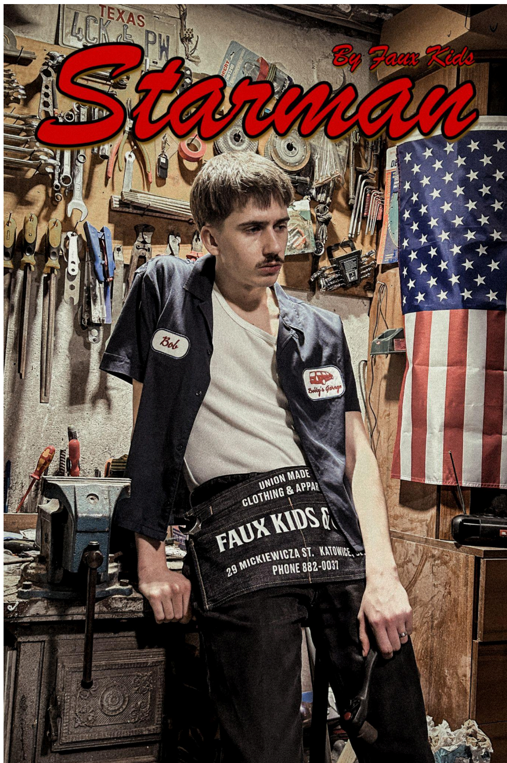
Fartuch reklamowy i koszula robocza